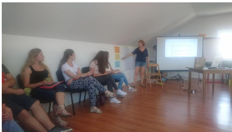
Razmjena znanja na edukaciji