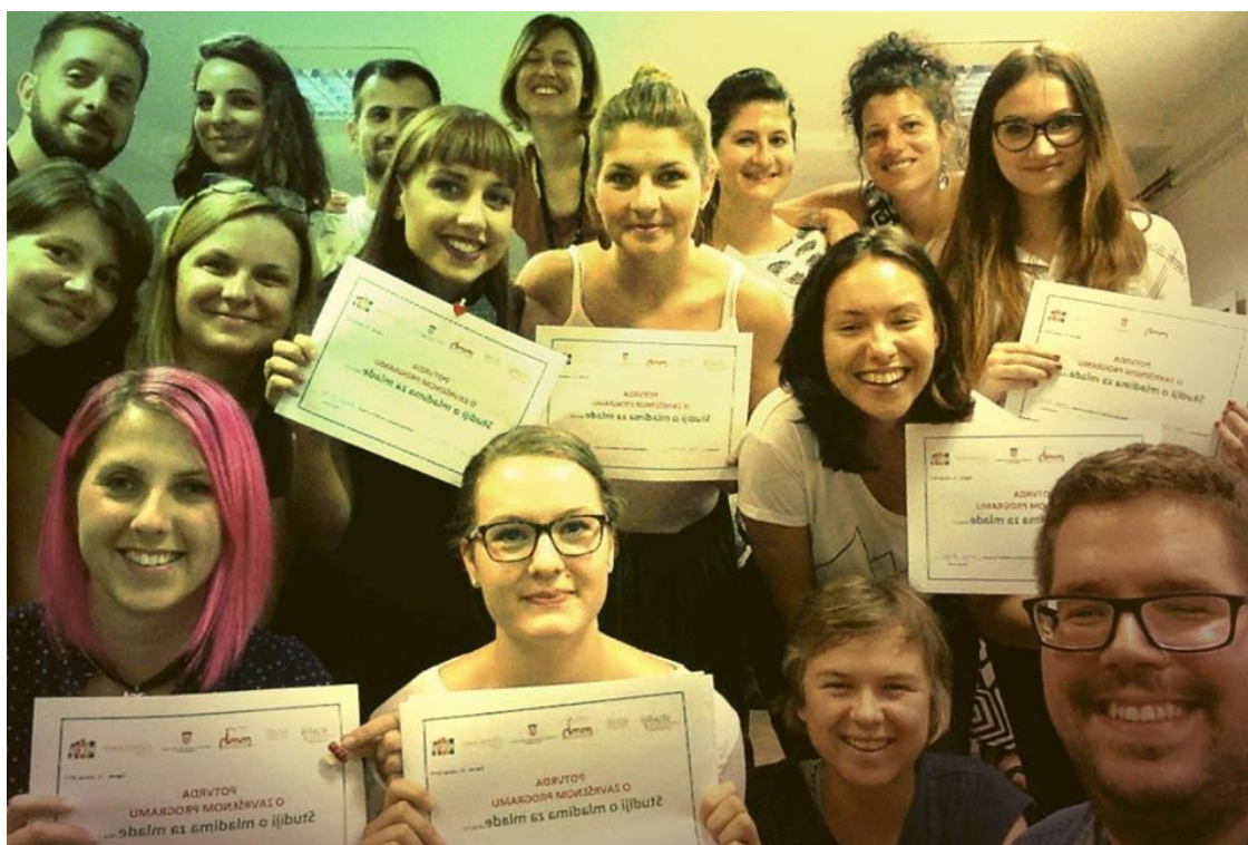
Ovogodišnja generacija Studija

Konačno, napominjemo kako je 2017. bila godina u kojoj je Studije o mladima za mlade uspješno završila sedma generacija, točnije trinaestero sudionika od četrnaest koji su program upisali. U sklopu ovogodišnjih Studija izvedena su tri modula – prvi koji se bavio radom s mladima u zajednici, drugi promocijom i zaštitom ljudskih prava, a treći politikama za mlade. Kao i prethodnih godina, polaznice su imale obvezu sudjelovanja u istraživačko-aktivističkom praktikumu, u kojem su dobivale podršku stručnog tima Studija . Njihovi radovi su sažeti u 8. biltenu Studija o mladima za mlade . U sklopu završnog modula održana je završna konferencija s oko 40 sudionika, na kojoj su iskustva u provedbi programa "Youth Studies" predstavili i Ross i Christine VeLure Roholt sa Sveučilišta u Minnesoti.