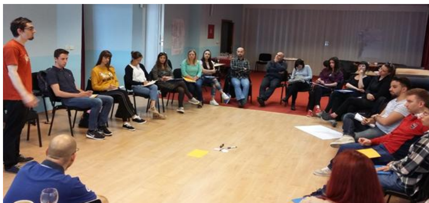
Dečki iz ACT grupe u facilitiranju