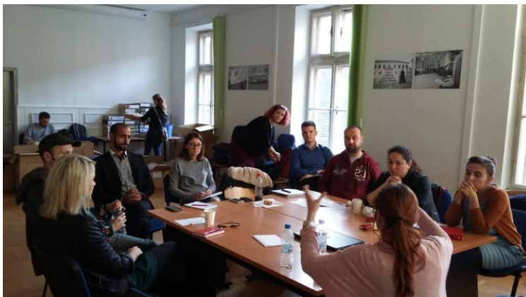
Ovako se planiralo...

Punim imenom „ Lokalne priče: put prema ljudskim pravima “ zahtjevni je projekt financiran iz posljednjeg ciklusa Instrumenta pretprijetne pomoći (IPA 2012) koji smo provodili u periodu od 1 mjeseci, a čija je provedba uspješno privedena kraju sredinom 2017. Godine. Partneri na ovom projektu su Udruga MoSt, Nansen dijalog centar, Udruga Igra, Centar za edukaciju, savjetovanje i