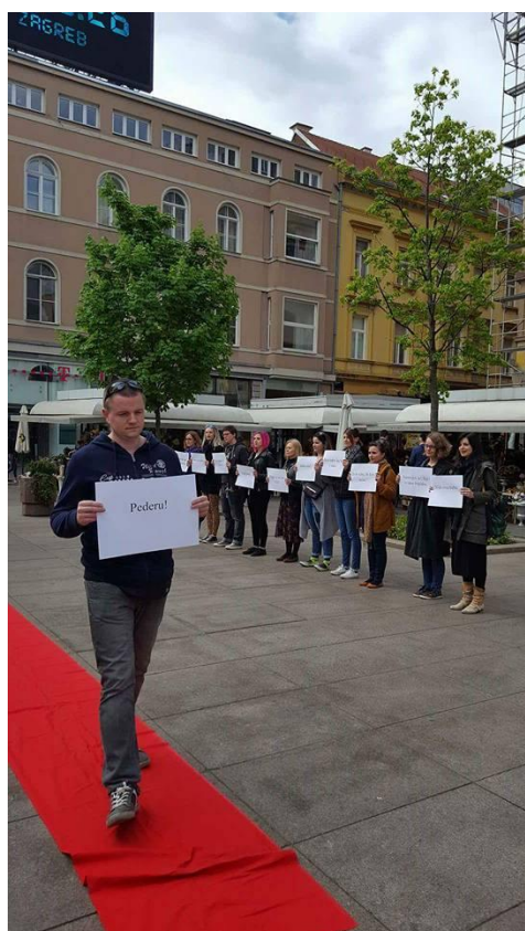
...a ovako osvještavalo javnost!

istraživanje (CESI), a zajednički smo radili na jačanju manjih, lokalno i korisnički orijentiranih udruga za zagovaračko djelovanje u polju ljudskih prava. Temeljem javnog poziva za sudjelovanje u programu su izabrane sljedeće udruge: Udruga Ardura Šibenik, Romska udruga mladih Brodsko-posavske županije, Krijesnica - udruga za pomoć djeci i obiteljima suočenim s malignim bolestima te Hollaback! Croatia.