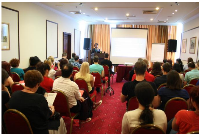
Rasprave na konferenciji